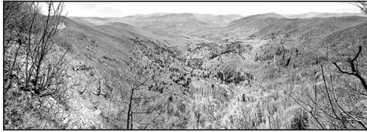
▲ Панорама з Рябої Скали.

Коли пробуджується у весняний час природа, тоді людині хочеться помандрувати рідним краєм і неодмінно завітати у наш найсхідніший регіон.