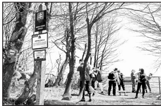
▲ Словацькі і польські туристи на верхів'ях гір.

чиною, на півдні – з Бескидським передгір'ям, на сході – з державним кордоном з Україною, а на півночі – з Польщею. Значна частина гірського масиву Буковські гори входить до складу Національного парку «Полонини». Найвища вершина гірського масиву – Кременець (1 221 м над рівнем моря).