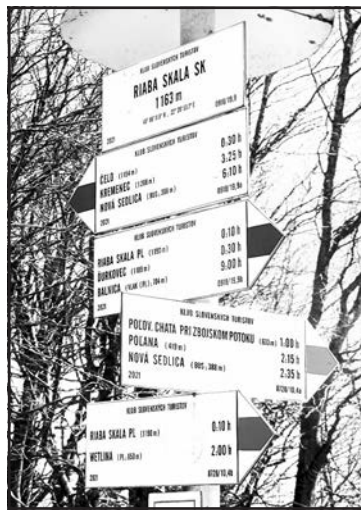
▲ Туристичні знаки на Рябій Скалі.

При Рябій Скалі збереглося різноманіття флори і фауни. Як зазначає Вікіпедія, тут зустрічається кілька рідкісних видів рослин, таких як оленьчий