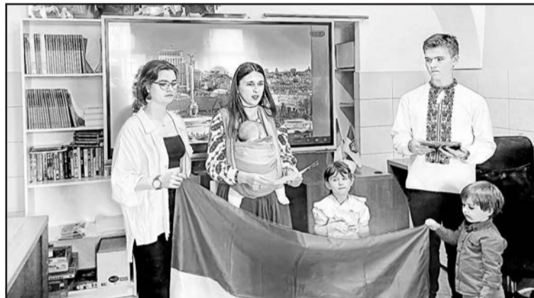
▲ Учасники зустрічі заспівали українські пісні.