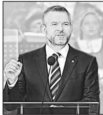
▲ Президент Словацької Республіки Петер Пеллегріні під час виступу на центральних урочистостях з нагоди 80-ї річниці Словацького національного повстання.

Ви, її горді представники, які сьогодні сидять тут, у перших рядах, поклали власні життя за цю свободу,