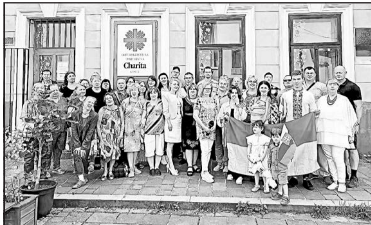
▲ Загальна світлина учасників зустрічі до 33 річниці Дня Незалежності України.

«Розвивайся Ти, високий дубе» Яною Булановою; Олександра Олеса «Живи, Україно, живи для краси»; Василя Симоненка «Я закоханий палко без міри» та сучасних поетів Ірини Мацкової «Моя сонячна Країна Україна», «Мої соколики, сини», «Присвята рідній землі» й молодого поета Олександра Перехреста «Що для мене Україна».