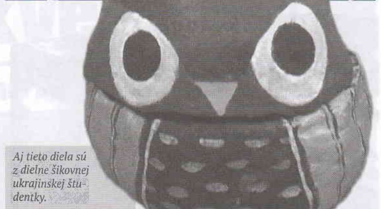
Aj tieto diela sú z dielne šikovnej ukrajinskej študentky.