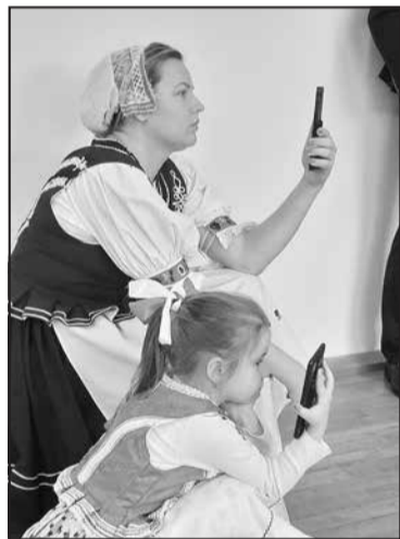
Пісня мила серцю дорослим і дітям.