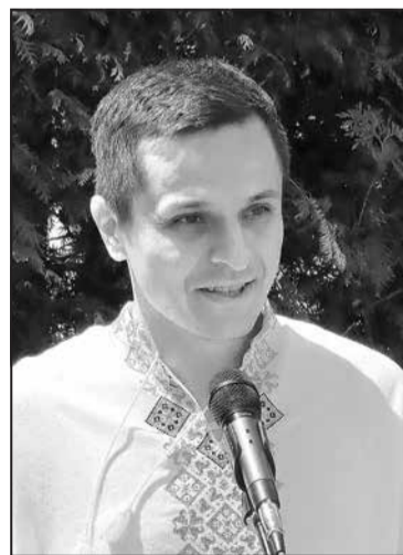
Слово вітання виголосив Генеральний консул України в Пряшеві Володимир Камарчук.