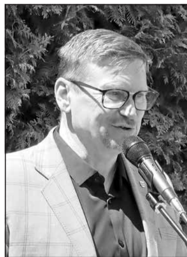
Зі святом українців привітав приматор міста Пряшів Франтішек Ольга.