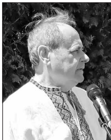
Голова ЦР СРУСР Павло Богдан завжди радий зустрічам з українцями, оцінив їх зусилля у збереженні рідного слова і культури.